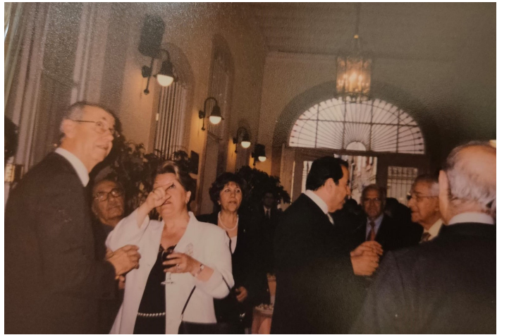
TPB İzmir Şubesinin Milli Egemenlik Günü Kokteyli