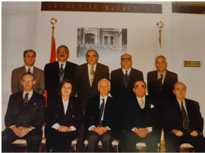
TPB İzmir Şubesi Yönetim Kurulu Üyeleri

2. katta ise TPB İzmir Şubesi ile Panelden-gösteriye, sergiden dinletiyeye her türlü kültürel etkinliğin yapıldığı sergi ve gösteri salonu bulunmaktadır.