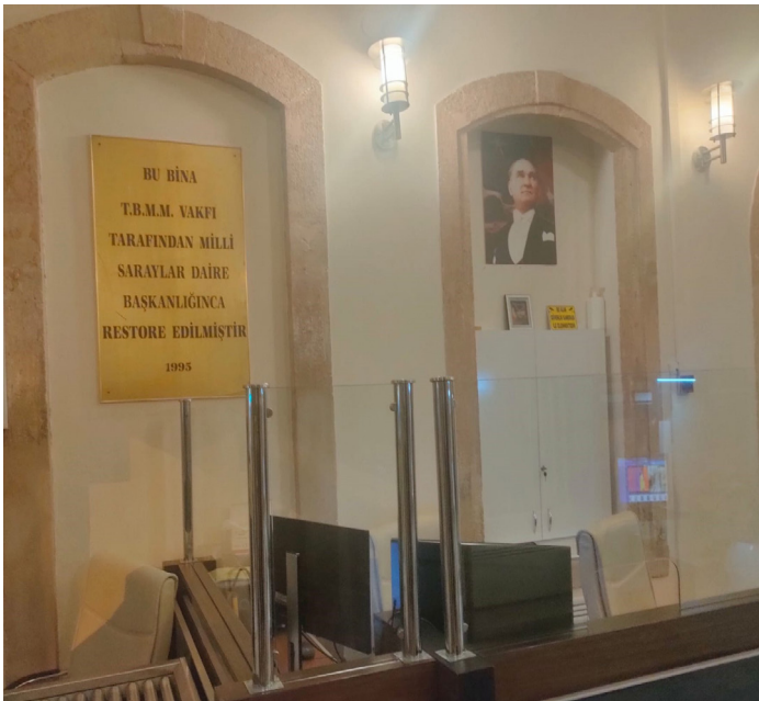
TBMM EGEMENLİK EVİ