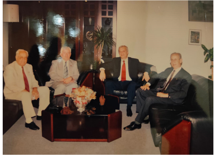
Büyükşehir Belediye Başkanı Ahmet Piriştina'nın TPB İzmir Şubesine Ziyareti.