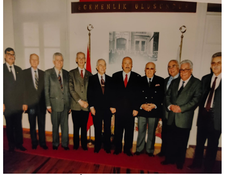
İzmir Valisi'nin TPB İzmir Şubesine Ziyareti.